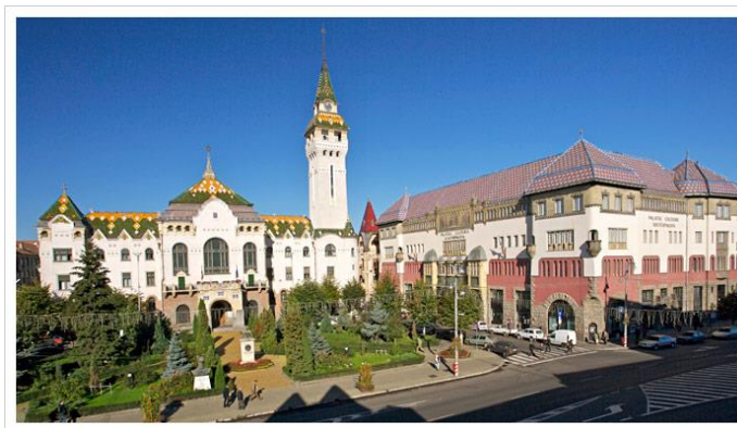
Fig. 1. Târgu Mureș. Palatul Culturii și Prefectura județului Mureș

4.4. Schemele, imaginile, graficele și hărțile se numerotează ca figuri, după cum exemplificăm: