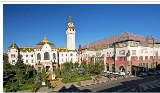
Fig. 1. Țirgu Mureș. Palatul Culturii și Prefectura județului Mureș

4.4. Schemele, imaginile, graficele și hărțile se numerotează ca figuri, după cum exemplificăm: